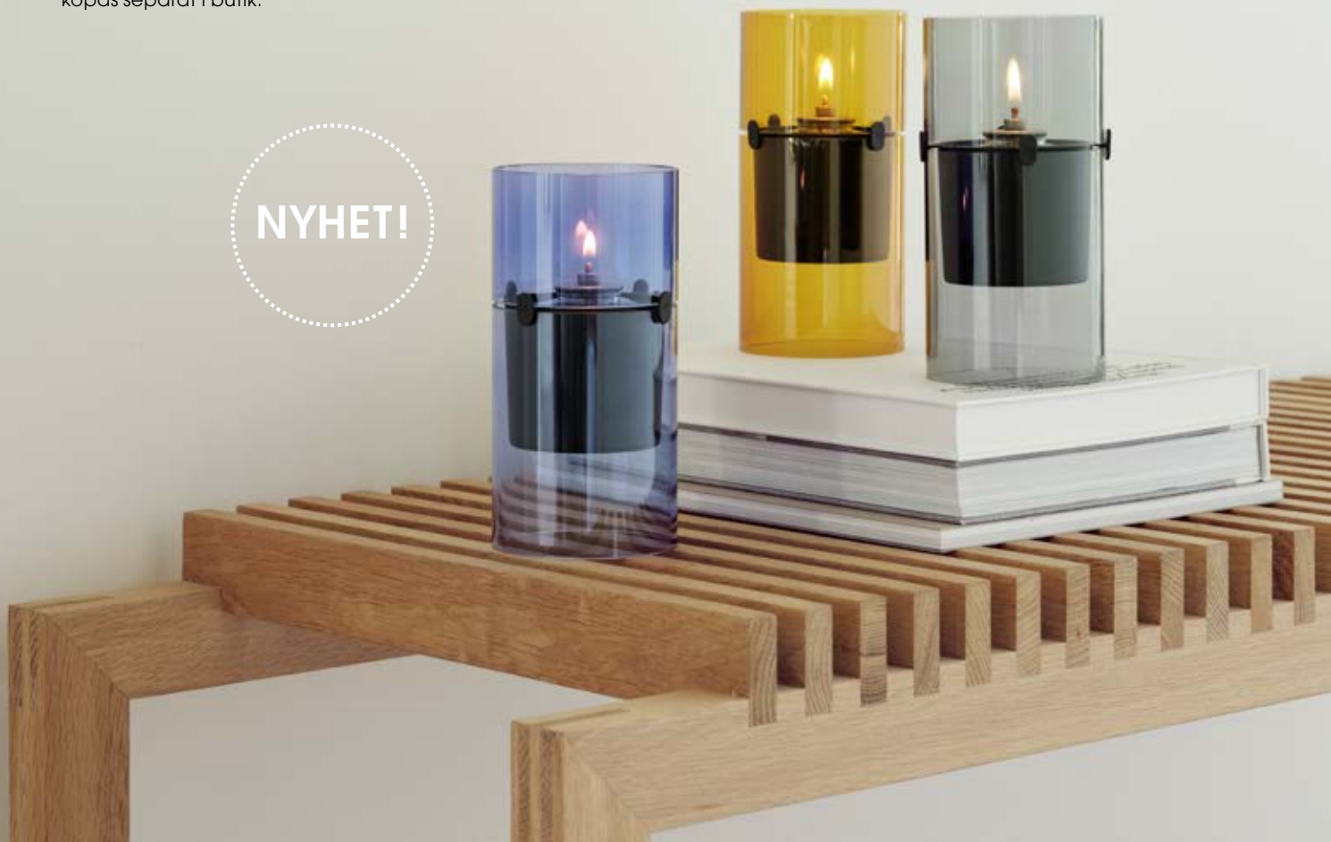
Smoke Art. nr. 497/R-96