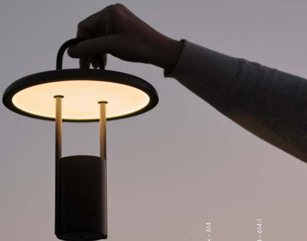
Black – 614