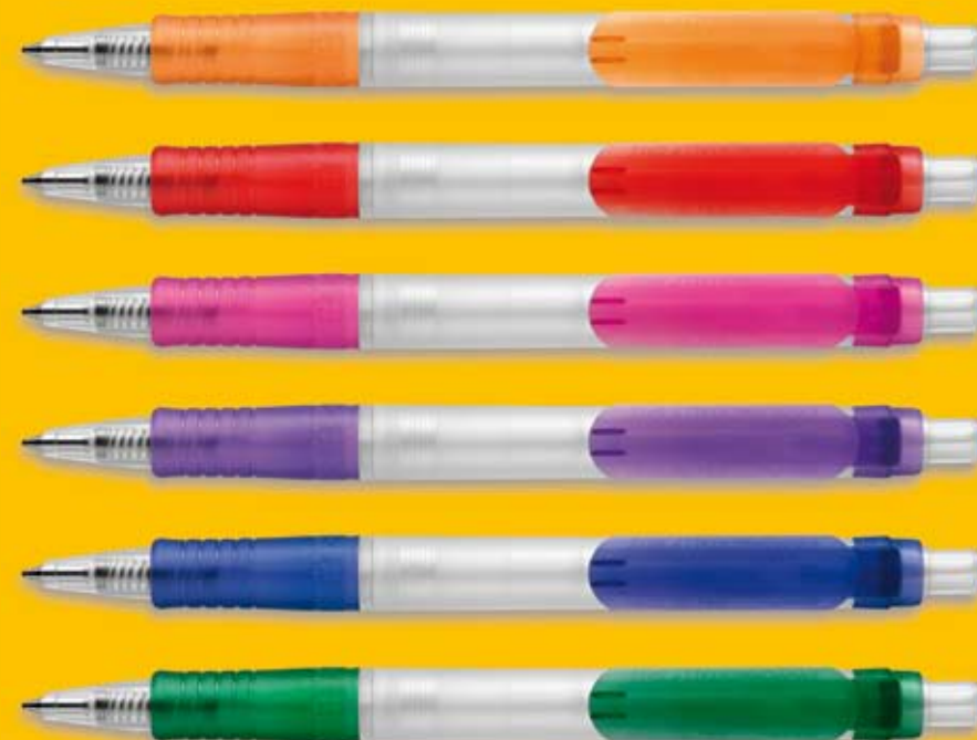
Vegetal Pen Clear

Produced by STILOLINEA, (TORINO, ITALY) and distributed by INGLI SWEDEN